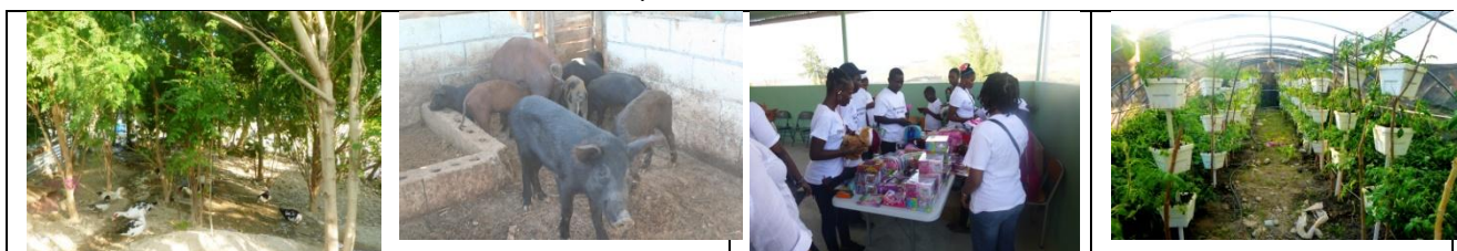
canards dans la verdure